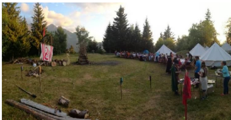
Le "plateau" où sont installées les tentes

Équipé pour accueillir jusqu'à 80 personnes, le bâtiment du grand chalet est autonome en électricité grâce à une installation photovoltaïque et un groupe électrogène au besoin. Il est approvisionné par l'eau d'une source captée en amont contrôlée régulièrement pendant l'été. L'eau est chauffée par des panneaux thermiques disposés sur le toit du chalet.