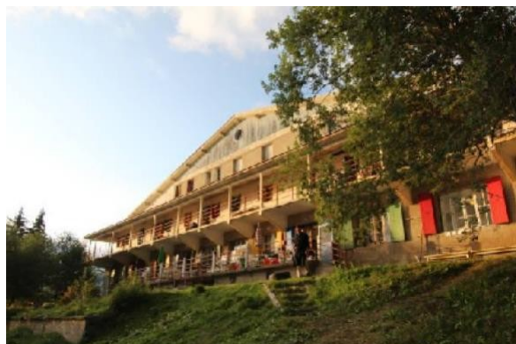
Le Chalet du Pré de l'Arc

Les enfants dorment sous de grandes tentes avec leur cordée, à proximité immédiate du grand chalet qui abrite la cuisine, le réfectoire, les sanitaires, des salles de jeux et les vestiaires.